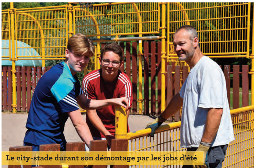
Le city-stade durant son démontage par les jobs d'été