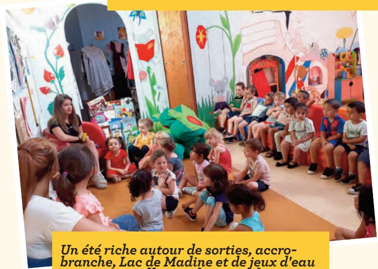
Un été riche autour de sorties, accrobranche, Lac de Madine et de jeux d'eau pour mieux affronter la canicule au Centre de loisirs.