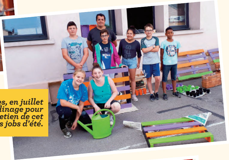
Les participants au chantier loisirs jeunes, en juillet dernier, ont créé un nouvel espace de jardinage pour les écoliers de Rimbaud. Un premier entretien de cet espace vert a été réalisé par les jobs d'été.