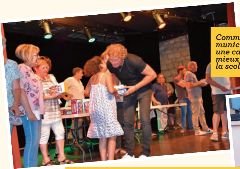
Comme chaque année à la veille des vacances estivales, la municipalité récompensait les élèves entrant en 6 e avec une calculatrice scientifique ou un dictionnaire, pour mieux les armer face au passage de cet important cap de la scolarité