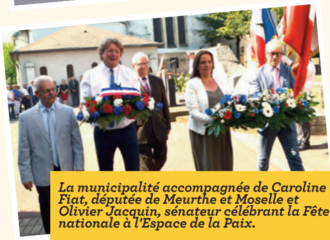
La municipalité accompagnée de Caroline Fiat, députée de Meurthe et Moselle et Olivier Jacquin, sénateur célébrent la Fête nationale à l'Espace de la Paix.