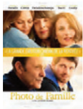
Photo de famille De Cecilia Rouaud Avec Vanessa Paradis, Camille Cottin, Pierre Deladonchamps, 1h38

Samedi 6 octobre à 17h Dimanche 7 octobre à 14h30