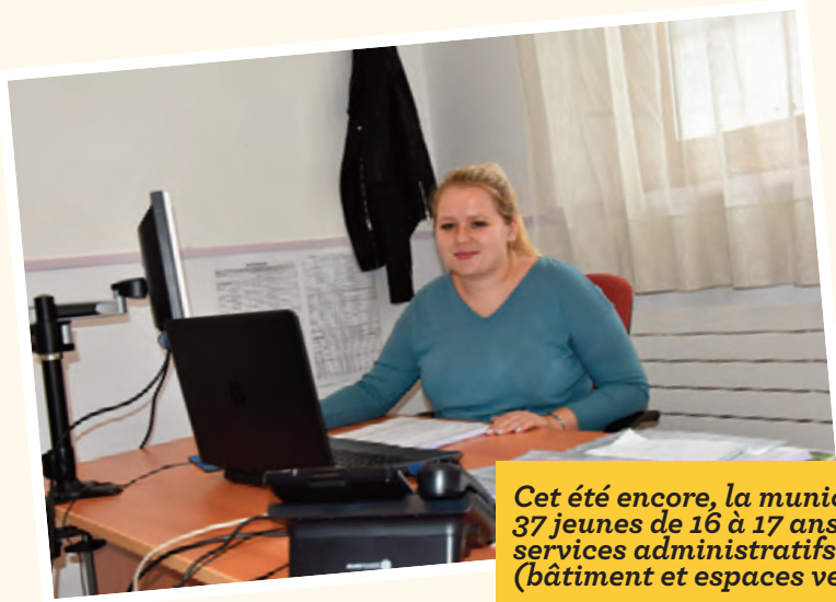
Cet été encore, la municipalité a recruté 37 jeunes de 16 à 17 ans en renfort aux services administratifs ou technique (bâtiment et espaces verts).