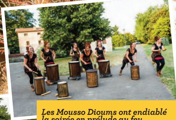
Les Mouso Dioums ont endiablé la soirée en prélude au feu d'artifice de la fête nationale. Musique de Dj Drums et buvette ont agrémenté la parade.