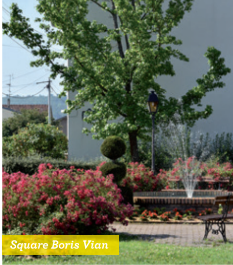
Square Boris Vian