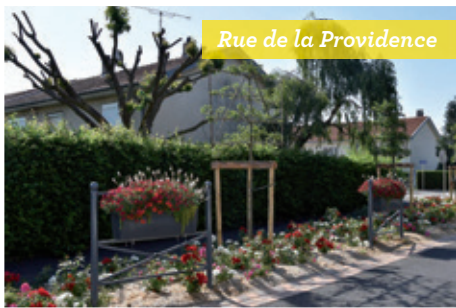
Rue de la Providence