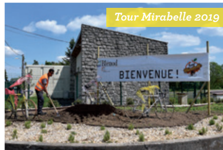
Tour Mirabelle 2019

Toute l’année, pour faire vivre la commune, les habitants et les acteurs associatifs et économiques locaux s’allient à nos services. Outre ce partenariat, la commune soutient les opérations de nettoyage de berges, bois ou forêt proposées par les associations ou le service jeunesse régulièrement porteurs de projets d’animations et de sensibilisation à l’environnement. D’autres actions ponctuelles et des projets intergénérationnels ont vu le jour : valorisation du Centre Pablo-Picasso, décoration végétalisée pour la cérémonie des vœux du maire, Tour de France, Tour de la Mirabelle, soupe de la solidarité, jardin sensoriel et aromatique au CCAS, aménagement du sas au foyer-Ambroise Croizat, animation “les fleurs en poésie” au centre de loisirs, visite du jardin botanique Jean-Marie Pelt, balade nature du groupe de marche et atelier “aquarelle” avec l’association Blénod animation loisirs. Les écoles ne sont pas en reste avec les projets menés par les enseignants dont ceux sur la mare de la biodiversité à l’école Aragon, les plantations pédagogiques et l’Éco-radio du Collège Vincent Van-Gogh, dont on retient la participation à la COP 23 en présence de Nicolas Hulot.