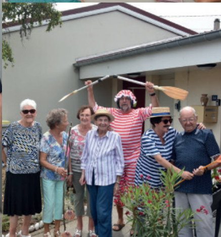
Des guinguettes à Blénod au mois de juillet & au mois d'août : même les plus jeunes s'y prêtent !