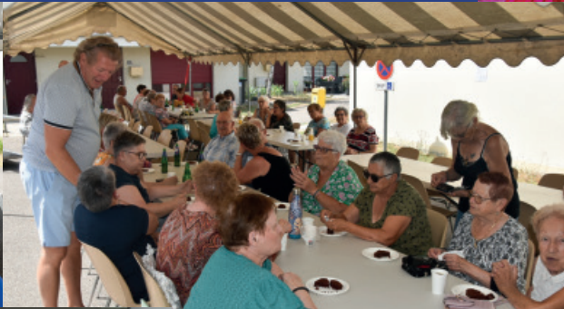
Zoom sur le traditionnel barbecue organisé à la résidence autonomie Ambroise-Croizat, en ouverture de saison estivale.