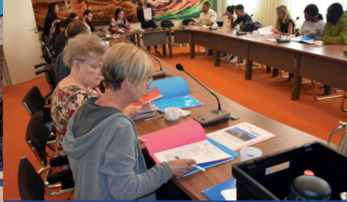
L'immeuble Altila, situé sur l'ancienne emprise foncière où se trouvait le magasin Aldi, accueille ses nouveaux locataires : les entrants ont signé leur bail de location avec Batigère, au sein de la mairie, début juillet !

Retour en images sur le séjour seniors en Andalousie, du 13 au 23 mai : nos voyageurs sont partis à la découverte du Triangle d'Or Andalou : de Cordoue à Grenade, en passant par Séville, ils ont pu en prendre plein les yeux ! Le séjour s'est fait en 2 temps : 4 nuits à Séville dans un hôtel 4*, puis 6 nuits à Benalmadena, en bord de mer.