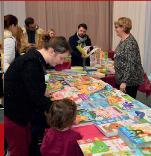
La fête du livre proposait des ateliers, des lectures théâtralisées, des spectacles, des défilés de cosplay et bien plus encore !