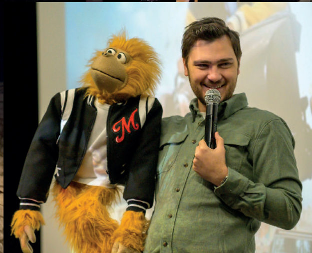
Rencontre avec Jeff Panacloc et Jean-Marc au Ciné Vilar pour la présentation de leur film en Avant-Première " Jeff Panacloc à la poursuite de Jean-Marc" .