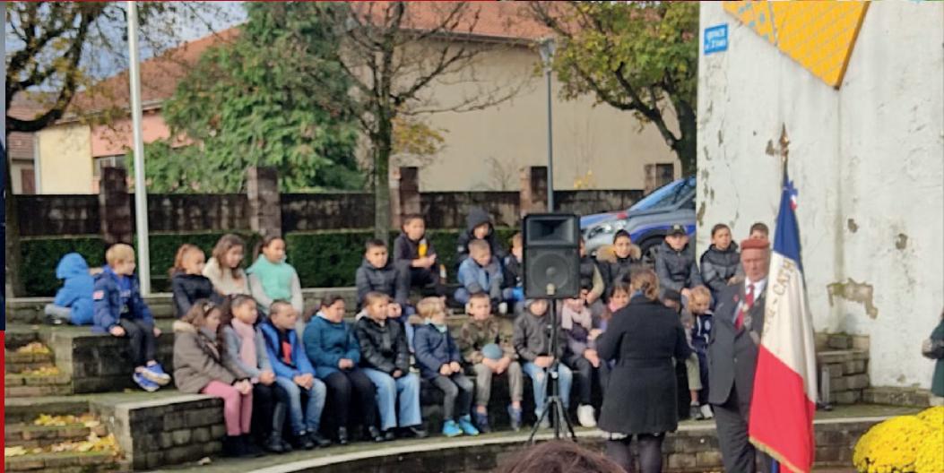
Cérémonie traditionnelle du 11 novembre à l'espace de la Paix puis au carré militaire, évènement lors duquel les enfants ont chanté l'hymne national.