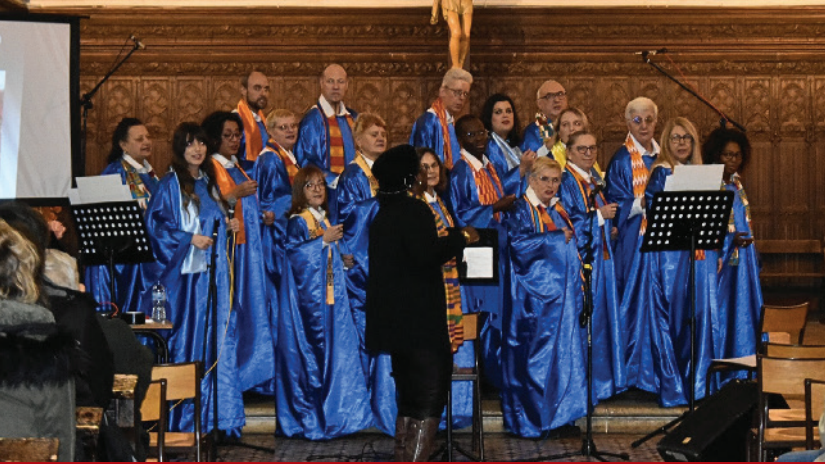
Gospel Mississippi a offert un concert inoubliable à l'église le 8 décembre dernier.

Grâce à votre générosité durant le mois d'Octobre Rose, c'est tous ensemble que nous avons récolté des fonds précieux à hauteur de 10 325 € !