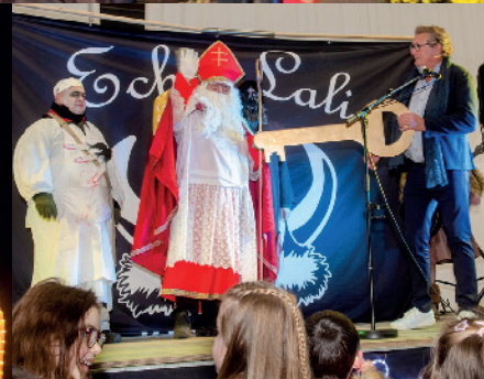
Soirée pleine de magie où le Saint Nicolas, le Père Fouettard et le boucher ont défilé dans la ville et où la Batucada et les 2 échassiers lumineux ont su mettre l'ambiance !